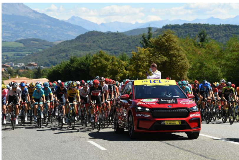
Christian Prudhomme, dans l'ENYAQ iV en 2021

Le constructeur automobile ŠKODA prendra le vendredi 1er juillet le départ du Tour de France aux côtés des coureurs pour la 19 ème année consécutive. Partenaire majeur de la Grande Boucle depuis 2004 et jusqu'en 2023 au moins, ŠKODA s'intègre dans cet événement en tant que fournisseur des voitures officielles de toute l'organisation d'A.S.O., dont la mythique voiture n°1 du directeur de course Christian Prudhomme, la ŠKODA SUPERB rouge depuis plusieurs années, remplacée depuis 2020 sur certaines étapes par l'ENYAQ iV rouge. Au cours de cette édition, pas moins de 16 des 21 étapes mettront à l'épreuve le SUV 100% électrique du constructeur tchèque.