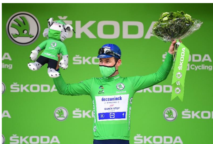
Mark Cavendish en 2021

100% de voitures électrifiées, : hybrides rechargeables et électriques au sein de la course Soucieuse de son environnement, ŠKODA intensifie ses efforts en matière de développement durable et renforce ses objectifs environnementaux. La marque tchèque a annoncé la réduction de plus de 50 % des émissions de sa flotte d'ici 2030 par rapport à 2020. Pour cette raison, le constructeur automobile et l'organisateur du Tour de France, A.S.O., poursuivent, à nouveau en 2022, leur engagement dans la transformation du Tour. 100% des voitures utilisées par l'organisation au sein de la course seront des modèles 100% électrifiés : hybrides rechargeables ou électriques.